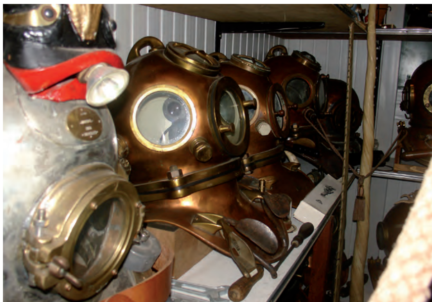
De volledige collectie bevat meer dan 25 complete helmen.

De ontvangst door de heer des huizes is hartelijk (nvdr: op vraag van de eigenaars van de collectie worden noch hun namen, noch hun contactgegevens vermeld). Ik zet me in de sofa. Rechts van me staat er een boekenkast met postzegels, tijdschriften, enz. Alles over duiken natuurlijk. Rechtsvoor een maquette van een helmduiker. Dit model is tot in de kleinste details uitgewerkt: duikhelm, duikpak, gewichten, slangen, stoel, ... Voor mij zit mevrouw, en achter haar een volledige uitrusting en twee helmen. In de ruimte achter haar nog meer duikmateriaal. Links aan de schouw een schilderij met zicht op zee en een duikhelm. Volgens mij een zeer uitgebreide verzameling, maar na ons gesprek stelt het koppel voor om hun verzameling te bekijken. Is er nog meer?