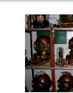
Tussen de oude helmen bevinden zich ook moderne versies.

Tussen de oude helmen bevinden zich ook moderne versies. Een aantal herken ik omdat ik er zelf al mee gedoken heb – behoor ik ook al tot de geschiedenis? Er staan ook enkele mannequins die volledig aangekleed zijn. Zelfs de communicatieapparatuur is aanwezig en volledig. Hier en daar hangt er een tekening tegen het beetje muuropervlak dat niet ingenomen is. Er is amper plaats om te stappen en overall wordt het zonlicht geweerd. Ik bekijk alles met het licht dat uit peertjes aan het