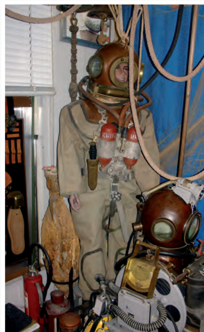
Iedere vierkante centimeter van het huis ademt duiken uit.

Hoewel hij er prat op gaat dat alles nog kan werken, heeft hij er nooit mee gedoken. Een verzamelstuk dat niet meer functioneert, is volgens hem niet waard om verzameld te worden. Zo hebben ze een volledige collectie oude wapens weggedaan, omdat ze alleen gedemilitariseerd behouden konden worden. Hierdoor waren ze onbruikbaar en dus onwaardig om te verzamelen. De vol-