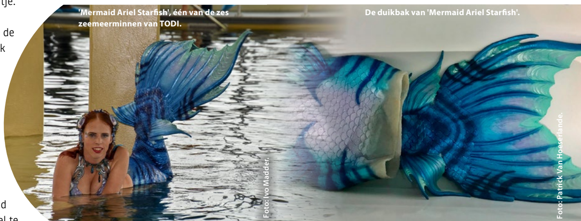
'Mermaid Ariel Starfish', één van de zes zeemeerminnen van TODI.